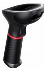
XL-SCAN 3610A 2D Bar-kod čitač

Da bi uvoz fiskalnih računa skeniranjem QR koda bio moguć neophodno je da kompjuter bude povezan sa 2D bar-kod čitačem ili mobilnom aplikacijom za čitanje QR kodova.