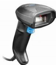
Datalogic Gryphon D4520 2D Bar-kod čitač