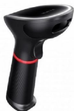
XL-SCAN 3610A 2D Bar-kod čitač

Da bi uvoz fiskalnih računa skeniranjem QR koda bio moguć neophodno je da kompjuter bude povezan sa 2D bar-kod čitačem ili mobilnom aplikacijom za čitanje QR kodova.